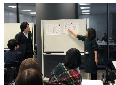
ターゲットやアプローチ方法について各チーム発表