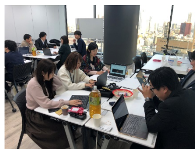
3チームに分かれてのグループワークの様子